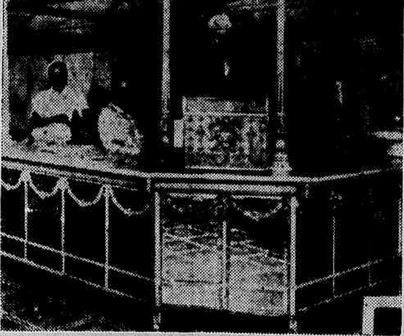
Um dos açougues que funcionaram hontem

Uma nota da Comissão Mixta de Tabellamento de generos alimenticios